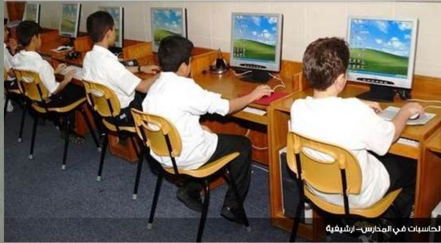
الحاسبات في المدارس - إرشيفية