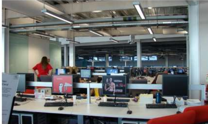
معمل حاسب آلي كمبيوتر كورس