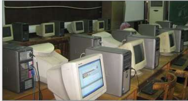
حاسبات المدارس أرشيفية